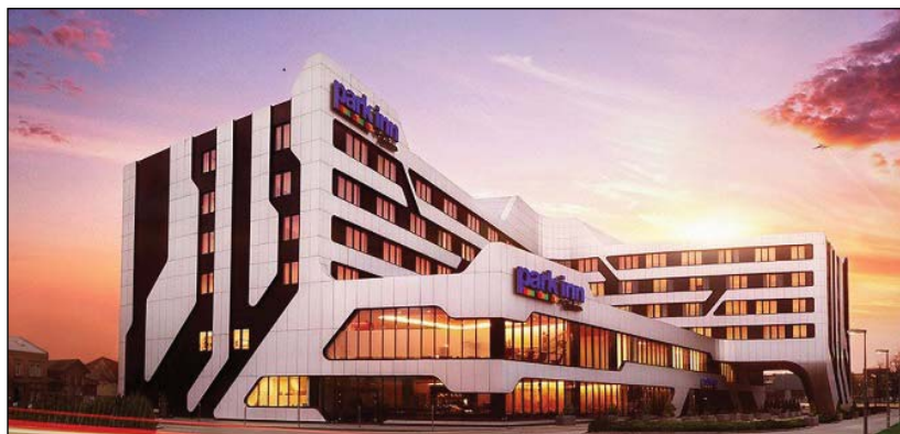
Hotel Park Inn

Liczymy na zainteresowanie i wsparcie kolegów z krajów CEE oraz innych części Świata. Zapraszamy!